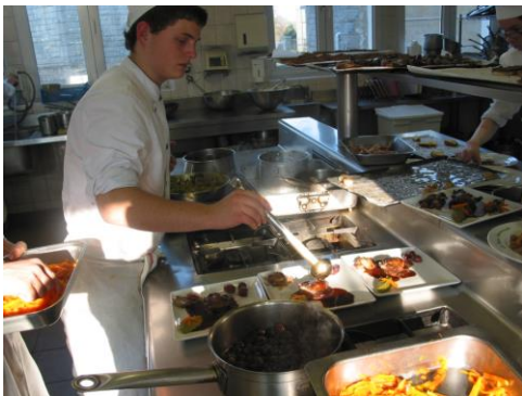
Hôtellerie André Pensivy